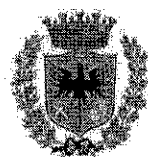
COMUNE DI FORLÌ